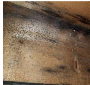
EXEMPLES DE MEUBLES AVEC DE LA MOISSURE ET DES CHAMPIGNONS